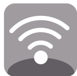
TELECOMUNICACIONES Y REDES